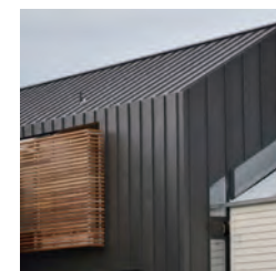
外装カラー鋼板パネル