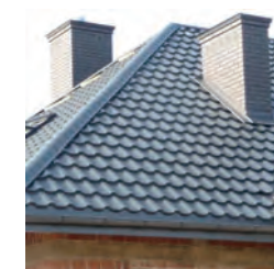
亜鉛メッキ アルミ屋根タイプ