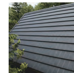
軽量で高強度の 鋼板パネル