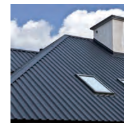
カラー塗装 鋼板屋根パネル